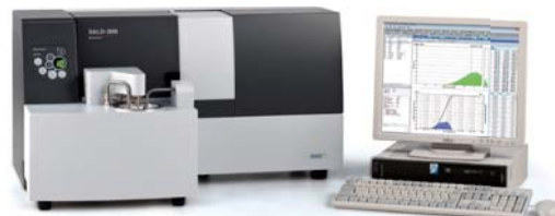
SALD-2300 с проточной ячейкой