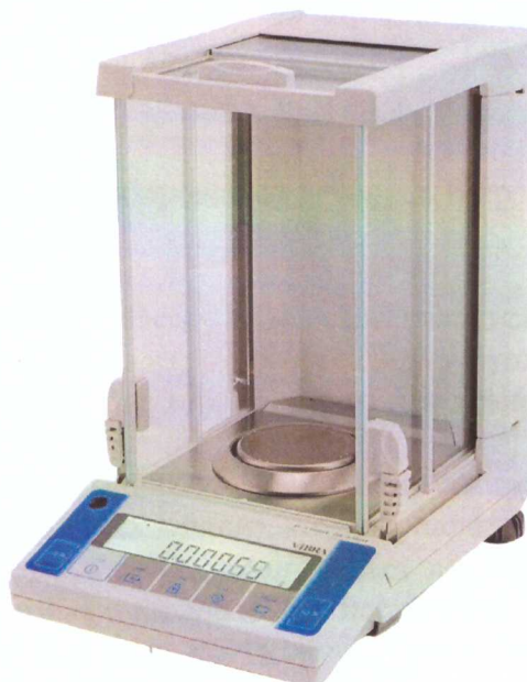
Рисунок 1 - Общий вид весов неавтоматического действия АФ.

Принцип действия весов основан на компенсации массы взвешиваемого груза электромагнитной силой, создаваемой системой автоматического уравнивания. Электрический сигнал, изменяющийся пропорционально массе взвешиваемого груза, преобразуется в цифровой код. Результаты взвешивания выводятся на дисплей.