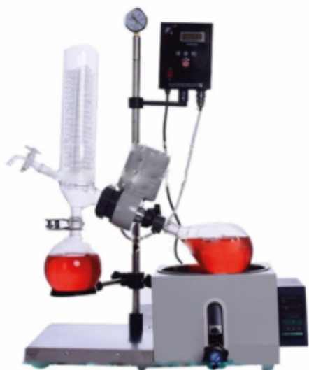
Роторный испаритель L'Orebo RE-201D (1 л)