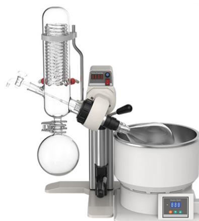
Роторный испаритель R-1001VN (1л, 2л)