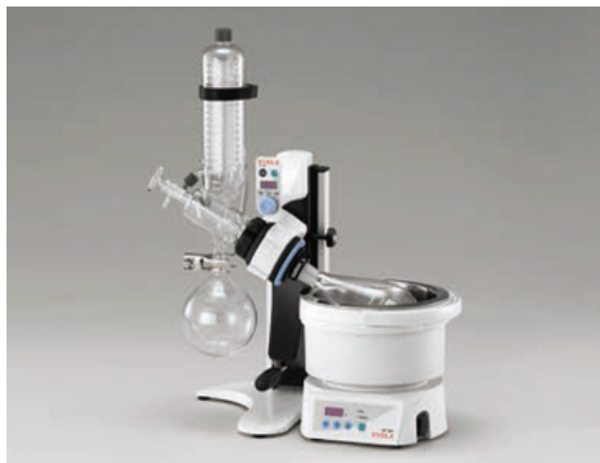
Роторный испаритель серии N-1300E · V · S