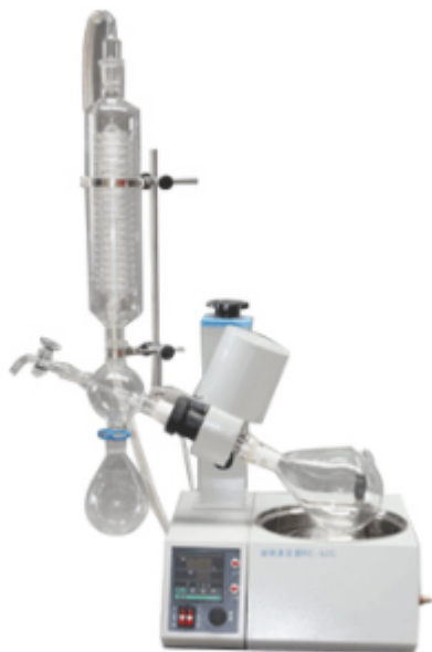
Роторный испаритель L'O-B RE-52C(52AA) (1 л)