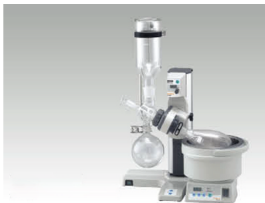
Роторный испаритель серии N-1200BT