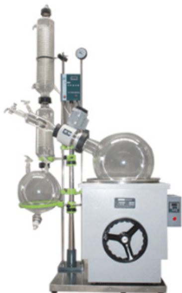
Роторный испаритель L'O-B RE-5003 (50 л)