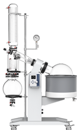
Роторный испаритель R-1020CE (20л)