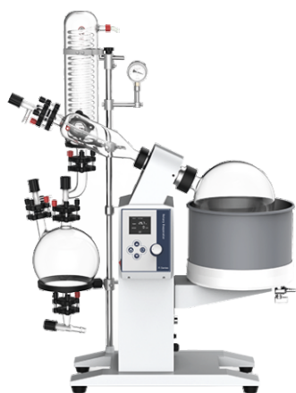
Роторный испаритель R-1005CE (5л)