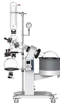
Роторный испаритель R-1010CE (10л)