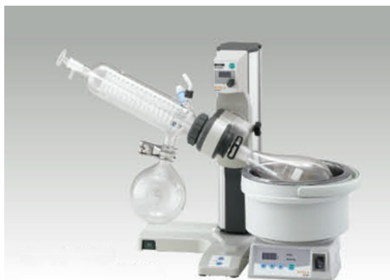
Роторный испаритель серии N-1200BS