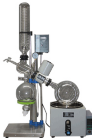
Роторный испаритель OLB RE-501 (5 л)