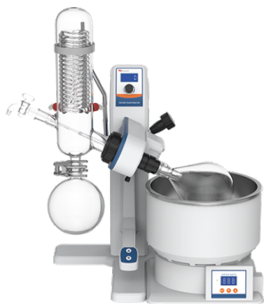
Роторный испаритель R-3001CE (1л, 2л)