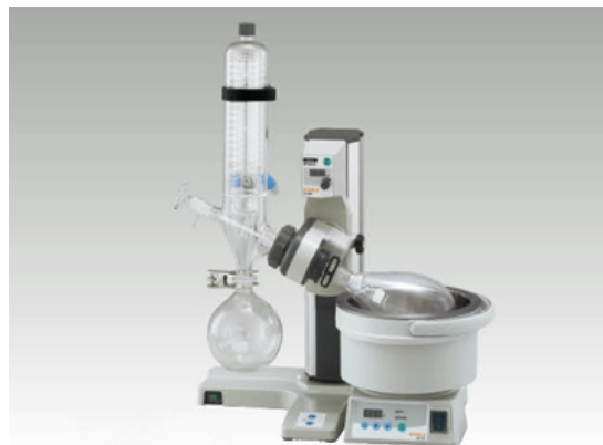
Роторный испаритель серии N-1200BV