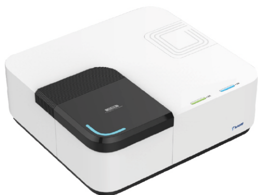
Флуоресцентный спектрометр FL970