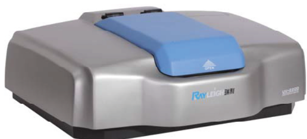
УФ-ВИД спектрофотометр UV-2200