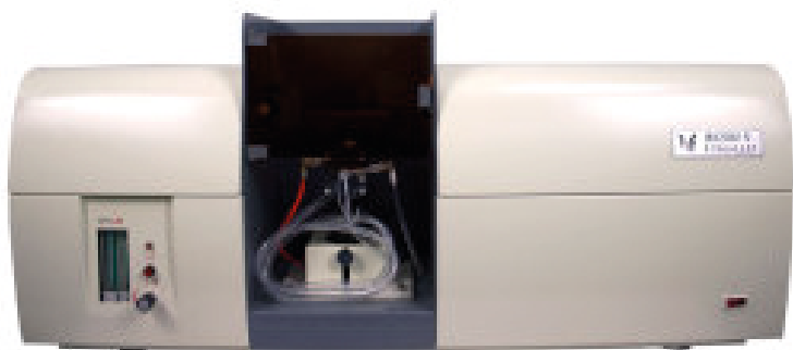
Атомно-абсорбционный спектрометр 4520B-Q