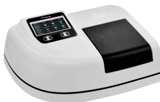
Однолучевой УФ-ВИД спектрофотометр S1010/1020