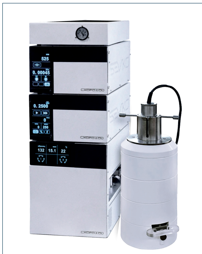
Рис.1. Жидкостный хроматограф «Скорход» с проточным гамма-радиометрическим детектором «МУЛЬТИРАД-гамма БДКС-25-02-2А»

Опираясь на актуальные запросы и используя лучший мировой опыт и новейшие технологии, производственно-инжиниринговая компания Sevko & Co разрабо-